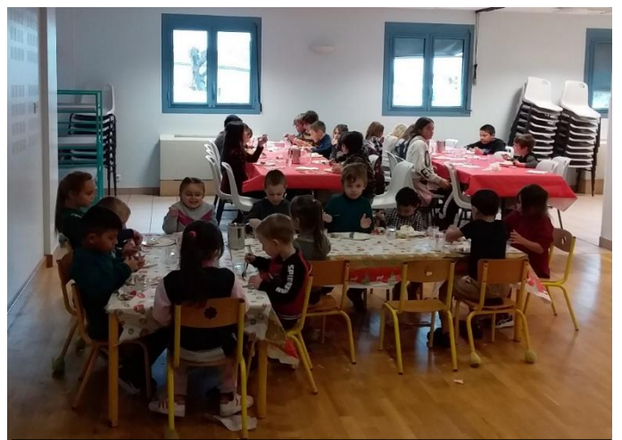
Repas de Noël à l'école le 21 décembre 2023