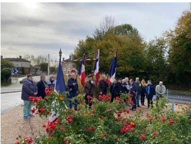
Cérémonie du 11 novembre 2023